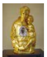
Delegazione Peregrinatio antoniana